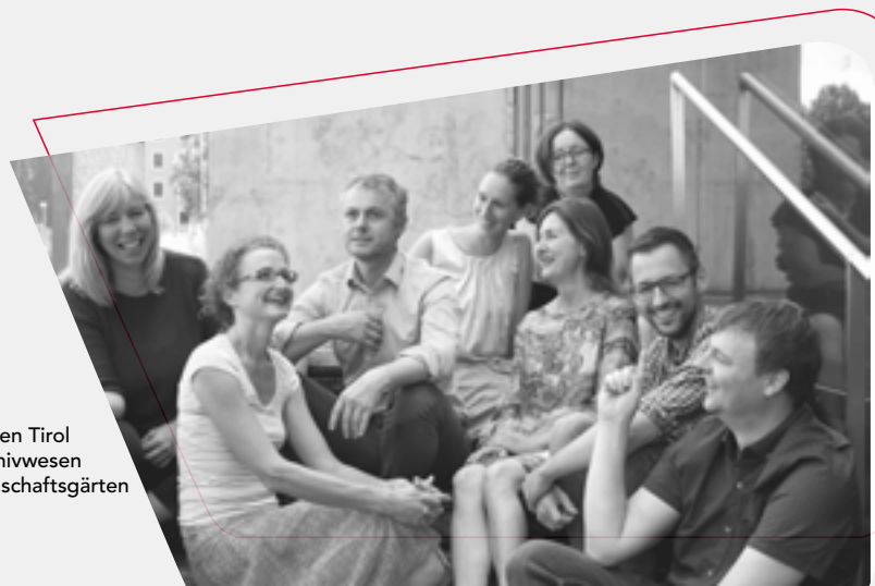
Das Team in der Geschäftsstelle des TBF.